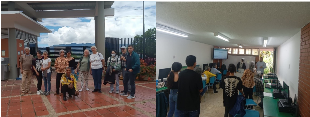
Figura 2: Explorando la universidad

Nota. Evidencia de los adultos mayores en el campus universitario.