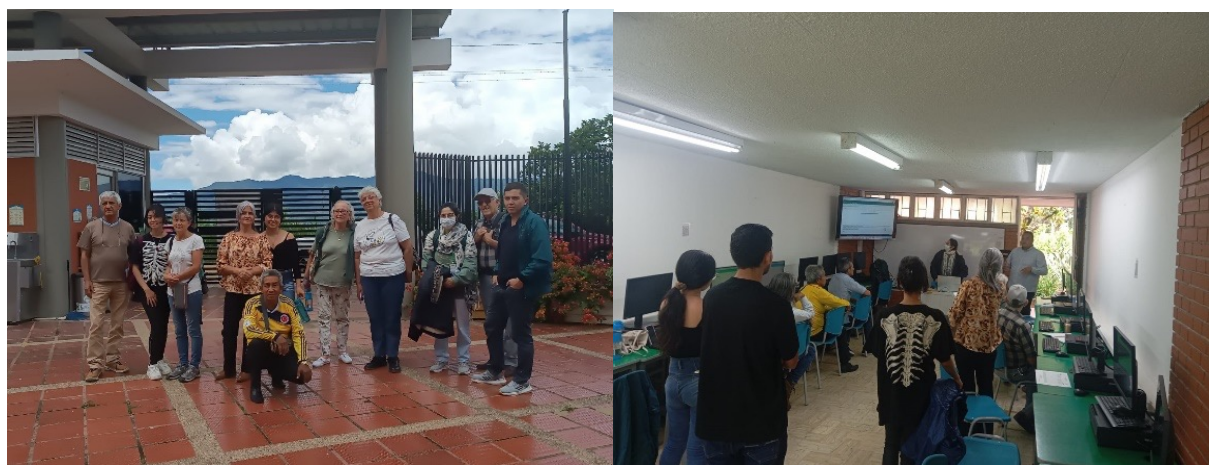
Figura 2: Explorando la universidad

Nota. Evidencia de los adultos mayores en el campus universitario.